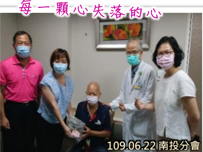
每一顆心失落的心 109.06.22 南投分會