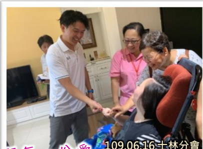
願每一份愛 109.06.16 士林分會