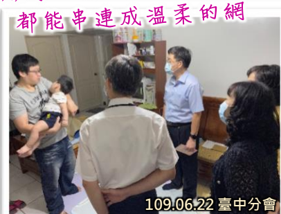
都能串連成溫柔的網 109.06.22 臺中分會