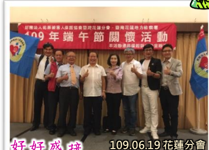
好好盛接 109.06.19 花蓮分會